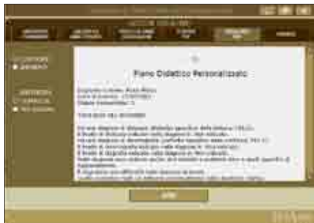
Schermata di visualizzazione del PDP da cui è possibile aprirlo con un editor di testo.

Può accadere, infatti, di rendersi conto solo alla fine di aver inserito un numero di voci eccessivo, con il rischio di riuscire a concretizzarne solo alcune, o di essersi imbattuti in una qualche contraddizione. Inoltre può essere necessario snellire il linguaggio e la forma per rendere maggiormente comprensibile e immediato il contenuto.