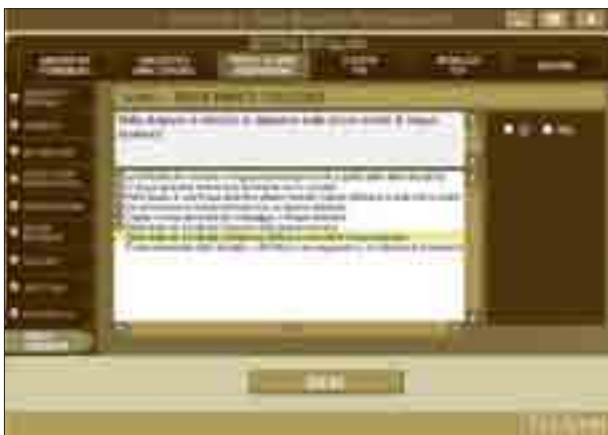
Schermata con le voci per la definizione del profilo dell'alunno: sezione inerente la lingua straniera.

Nel profilo che i docenti delineano, oltre a inserire i dati relativi a dislessia e disortografia, vengono introdotte le voci sul livello cognitivo nella norma, su una certa difficoltà nella memoria di lavoro e sulla dispensa dalle prove scritte di lingua straniera, così come indicato nella diagnosi stessa.